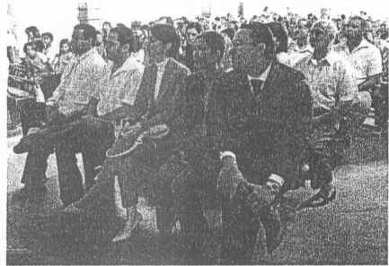
Autoridades também estiveram presentes na apresentação do Grupo Diadorim em Guanhães.

Não bastasse a música do Grupo Diadorim, a família também encanta a todos que acompanham o concerto pelo carisma e simpatia.