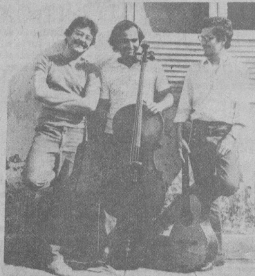
Grupo de Câmara da Fundação de Educação Artística

A criação de um espaço permanente dedicado à música de câmara tem encontrado um grande apoio da Fundação de Educação Artística, através de projetos como os ciclos anuais de música de câmara e muitos outros projetos de cursos intensivos de música de câmara, barroca e contemporânea. Para a divulgação do gênero camerístico, a Fundação de Educação Artística tem um projeto de transformar o seu auditório, o pequeno Teatro Heloísa Guimarães, com capacidade para 150 pessoas, num espaço destinado à programação semanal de música de câmara, num importante traba-