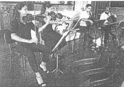
O Grupo Diadorim executou um repertório bastante variado de música de câmara universal e brasileira

A Igreja São Miguel e Almas foi palco na manhã do dia 30 de abril de um concerto de música erudita. A igreja ficou lotada para acompanhar o Grupo de Câmara Diadorim, de Belo Horizonte, que fez um passeio por 300 anos da música clássica, começando pelo século 16 e encerrando com Bachianas brasileiras nº 2, "Tocata" - mais conhecida como "O Trenzinho do Caipira", de Heitor Villa-Lobos.