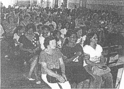
A Igreja São Miguel e Almas ficou lotada para acompanhar o concerto de música erudita.